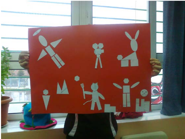
Εικόνα 2. Κολάζ των μαθητών με γεωμετρικά σχήματα στο σχολείο.