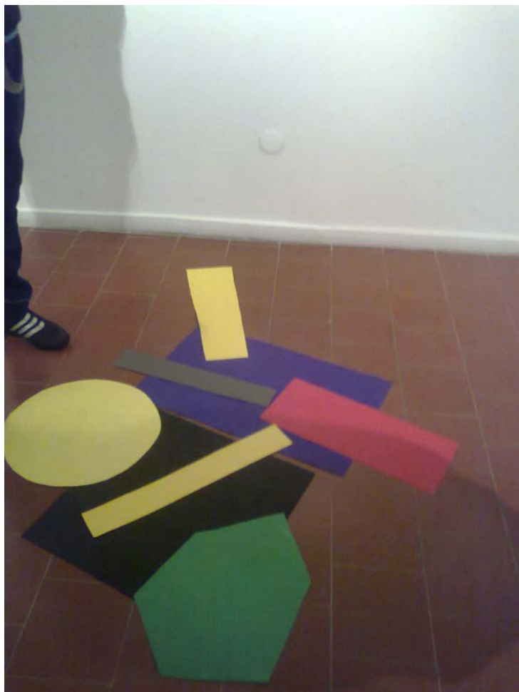
Εικόνα 1. Ομαδική σύνθεση των μαθητών στο Κρατικό Μουσείο Σύγχρονης Τέχνης.