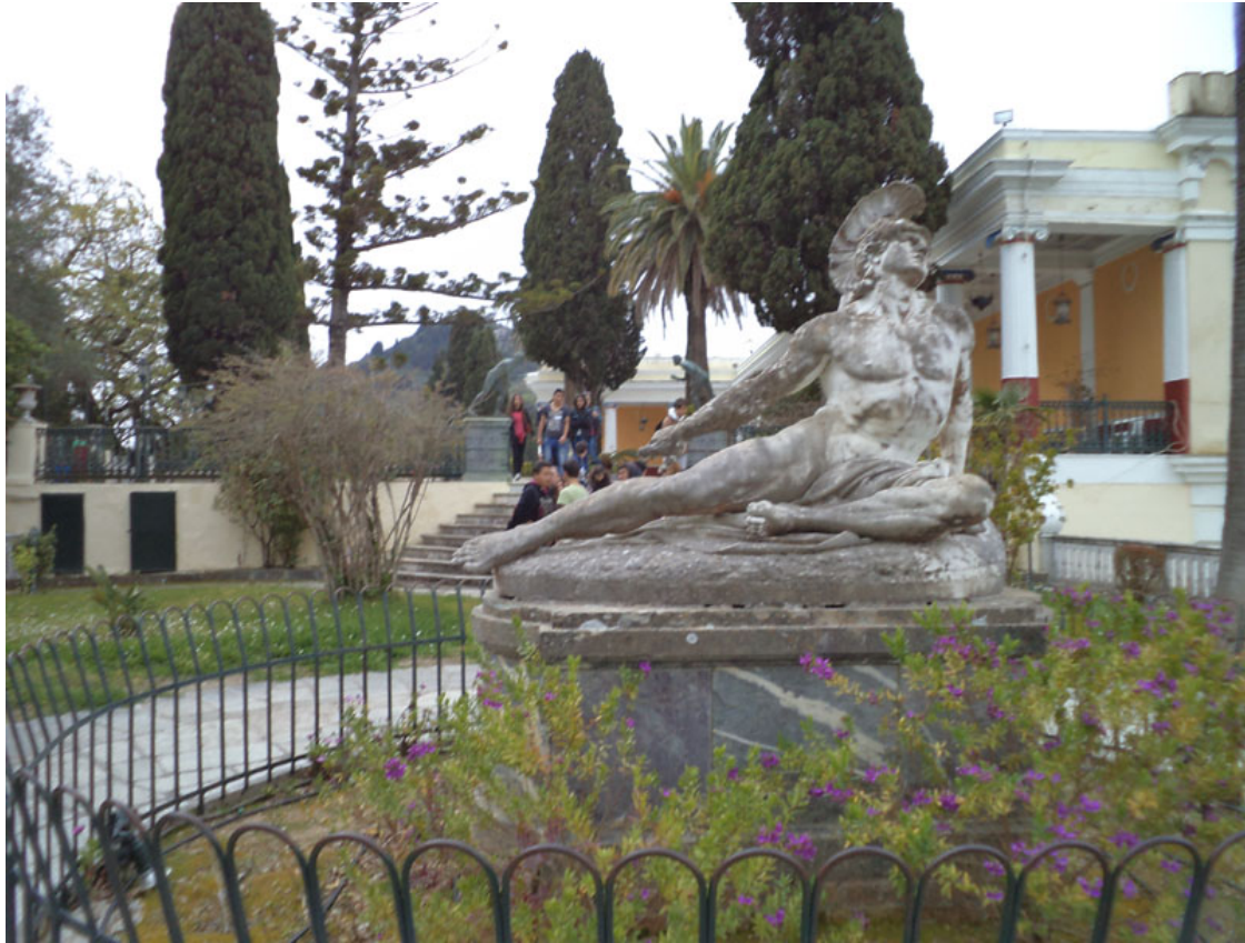
Ο θνήσκων Αχιλλεύς