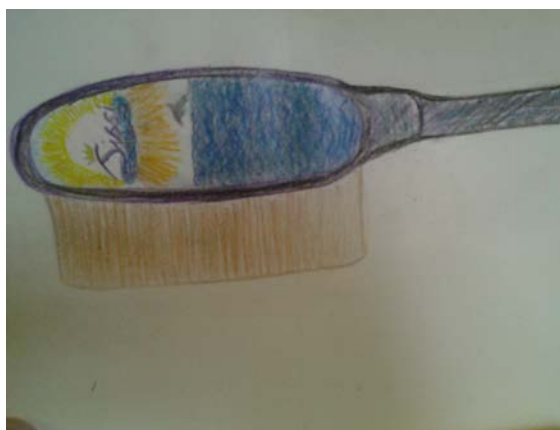
Αντικείμενο που σχεδιάστηκε από μαθήτρια για το πωλητήριο του Αχίλλειου

14. Οι περισσότεροι μαθητές με δική τους πρωτοβουλία εργάστηκαν σε κάποιες από τις παραπάνω δραστηριότητες κατά τη διάρκεια των διακοπών του Πάσχα. Οι εργασίες παραδόθηκαν στην εκπαιδευτικό στις 28/04/2014.