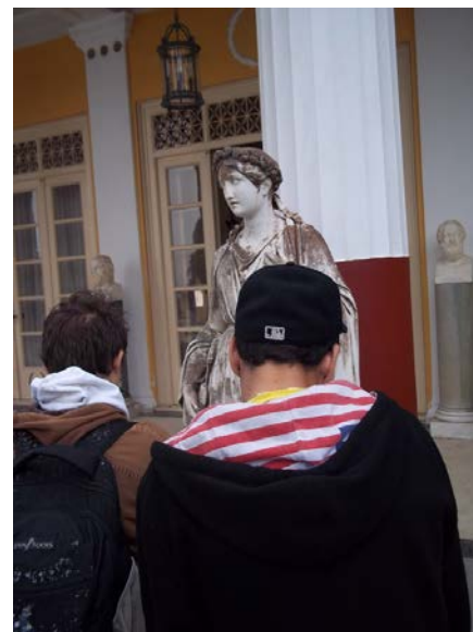
Παρατηρούμε τις Μούσες