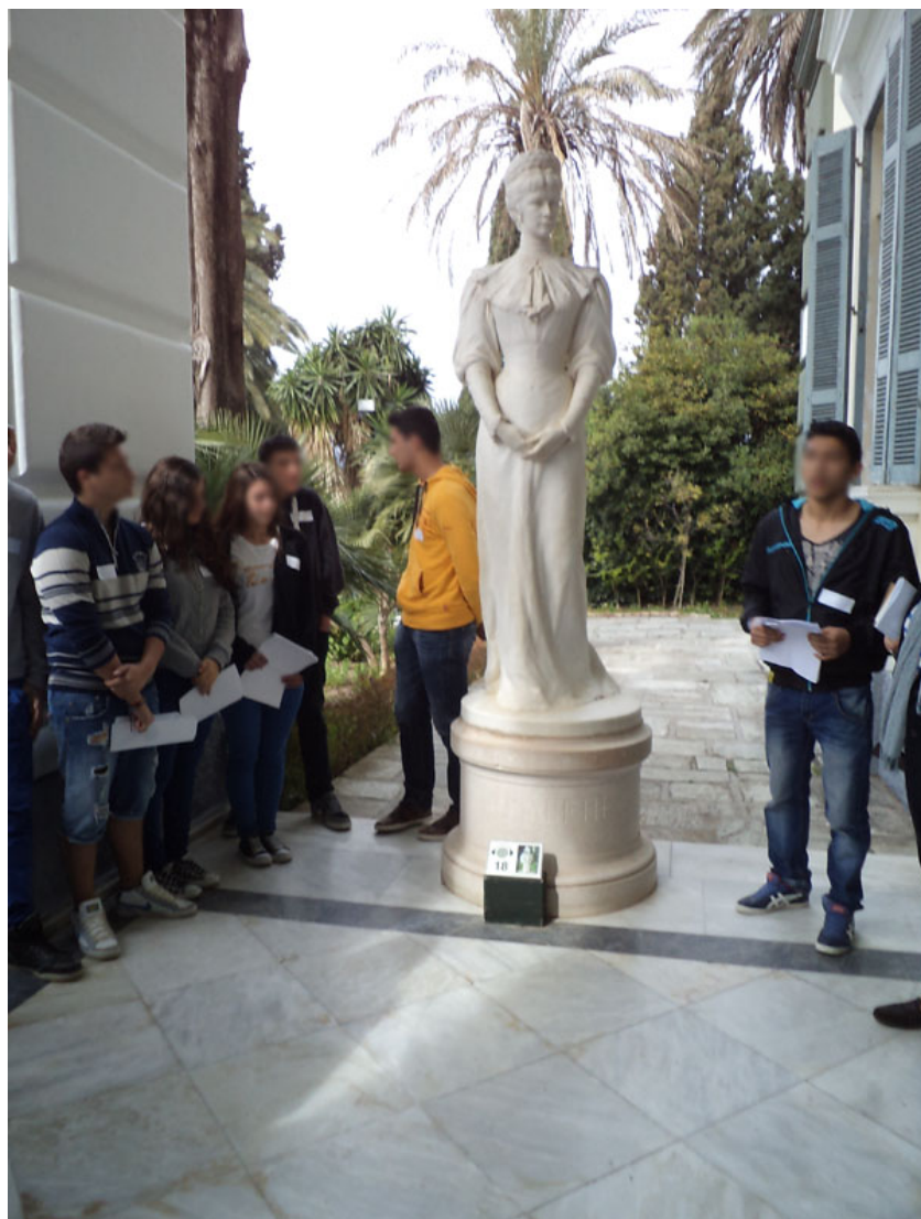
Το άγαλμα της αυτοκράτειρας Ελισάβετ στην είσοδο του Αχιλλείου

12. Το εκπαιδευτικό πρόγραμμα υλοποιήθηκε στο Αχίλλειο στις 4 Απριλίου. Η υπεύθυνη και η συνεργάτιδα της υποδράσης 9.5 μετέβησαν στο Αχίλλειο πριν τους μαθητές, επισκέφτηκαν τον κύριο Σαγιά, περιηγήθηκαν στους χώρους του Αχίλλειου και κανόνισαν τις τελευταίες λεπτομέρειες. Στη συνέχεια, υποδέχτηκαν τους μαθητές του 5 ου ΓΕΛ Κέρκυρας που συμμετέχουν στο μάθημα «Ελληνικός και Ευρωπαϊκός πολιτισμός» καθώς και τους υπόλοιπους μαθητές της Α΄ Λυκείου. Οι μαθητές του τμήματος ξενάγησαν τους συμμαθητές τους με βάση τις θεματικές των φύλλων εργασίας. Παρά την πολυκοσμία, οι ξεναγήσεις έγιναν με τον καλύτερο δυνατό τρόπο. Οι μαθητές και οι μαθήτριες που συμμετείχαν στο πρόγραμμα είχαν εργαστεί καλά και ξενάγησαν ικανοποιητικά όσους από τους συμμαθητές τους (περίπου τους μισούς από το συνολικό αριθμό μαθητών της Α΄ λυκείου) ήθελαν να παρακολουθήσουν.