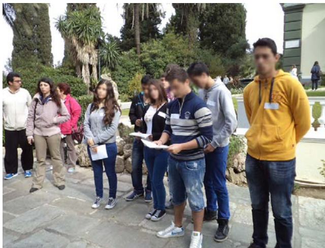
Ξεναγηση από μαθητές