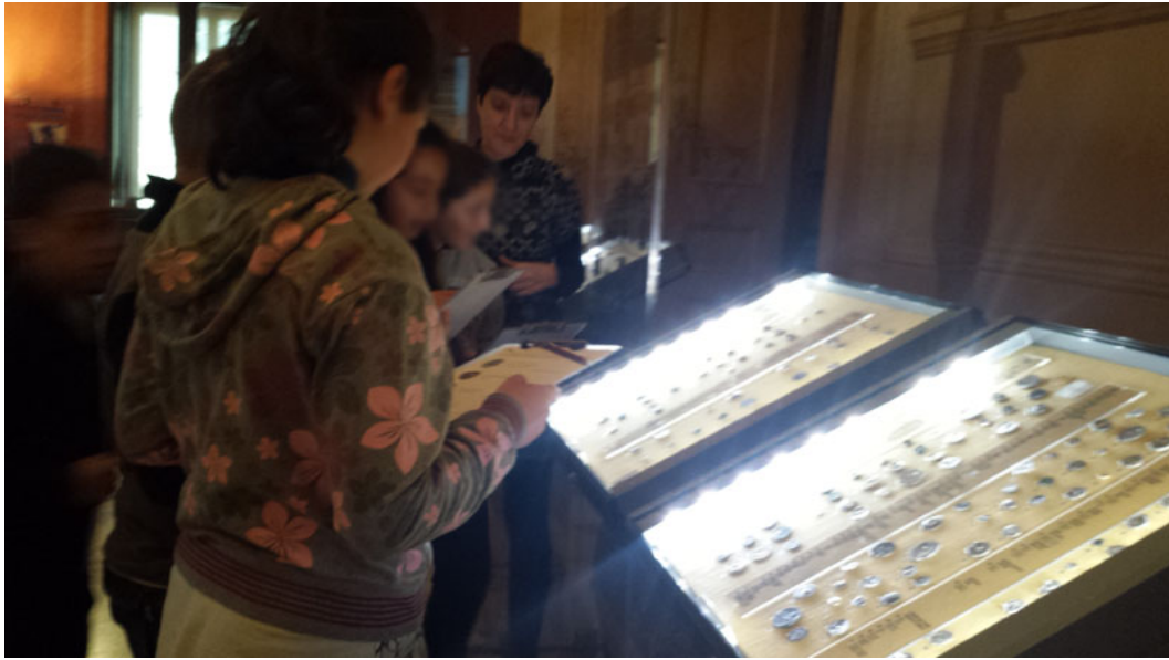
Τα παιδιά ερευνούν και ανακαλύπτουν ζώα και φυτά στα νομίσματα του Νομισματικού Μουσείου Αθηνών