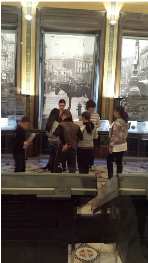
Τα παιδιά ερευνούν και ανακαλύπτουν ζώα και φυτά στο κτίριο του Νομισματικού Μουσείου Αθηνών