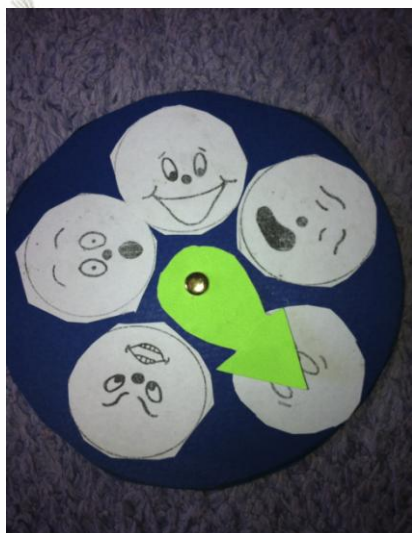
Εικόνα 2. Το ρολόι των συναισθημάτων.

Δραματοποίηση-παιχνίδι: Τα παιδιά χωρίζονται σε ομάδες. Μια ομάδα με παντομίμα εκφράζει ένα συναίσθημα. Οι υπόλοιπες βρίσκουν το συναίσθημα και γυρνούν το δείκτη σε αυτό το συναίσθημα.