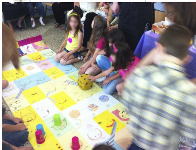
Εικόνα 9. Παίζουμε με το φιδάκι των συναισθημάτων στο τέλος της σχολικής χρονιάς.

Ο παίκτης (ένας κάθε φορά από κάθε ομάδα) ρίχνει το ζάρι και προχωράει το πιόνι τόσα τετράγωνα όσα λέει το ζάρι. Αν φτάσει, π.χ., στο τετράγωνο που λέει: “Θύμωσες και χτύπησες τον φίλο σου”, κατεβαίνει 10 τετράγωνα με το φιδάκι. Αν φτάσει στο τετραγωνάκι που λέει: “Η συμμαθήτριά σου κλαίει κι εσύ πήγες να την παρηγορήσεις. Μπράβο!» ανεβαίνει 10 τετράγωνα με τη σκαλίτσα. Νικητής είναι όποιος φτάσει στο τέρμα (είτε πρώτος είτε τελευταίος).