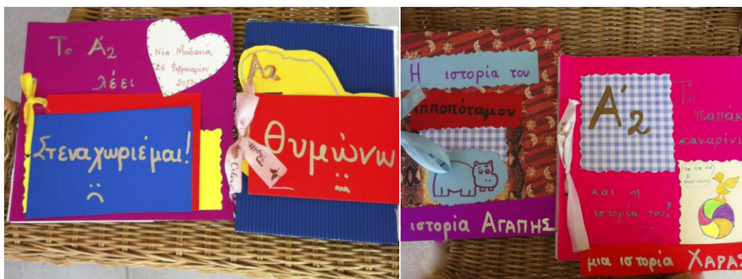
Εικόνες 3-4. Τα βιβλία των συναισθημάτων.