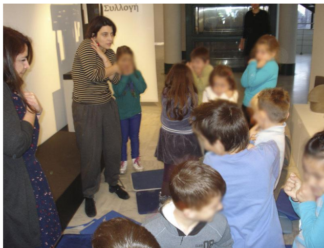
Εικόνα 7. Παιχνίδι μίμησης των αγριών ζώων σε άμυνα.