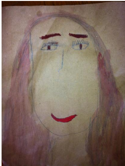
Εικόνα 1. Παιδική αυτοπροσωπογραφία.