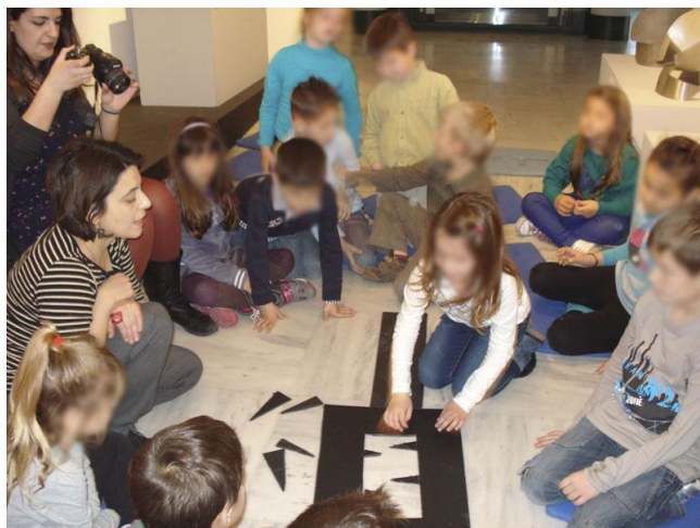
Εικόνα 6. Παιχνίδι με τα γεωμετρικά σχήματα με αφορμή το έργο της Άλεξ Μυλωνά.

Στη συνέχεια, τα παιδιά μέσα από ένα παιχνίδι αποδόμησης και ανασύνθεσης του έργου αναγνώρισαν βασικά γεωμετρικά σχήματα και τα συνέδεσαν μεταξύ τους. Τα παιδιά κατανόησαν το πλήρες και το κενό στη γλυπτική.