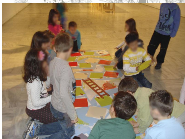
Εικόνα 8. Επιδαπέδιο παιχνίδι εμπέδωσης εννοιών.

Το πρόγραμμα ολοκληρώθηκε με ένα επιδαπέδιο παιχνίδι εμπέδωσης εννοιών. Οι ερωτήσεις αφορούσαν τόσο τεχνοτροπικά στοιχεία των έργων τέχνης όσο και τρόπους διαχείρισης συναισθημάτων σε διαφορετικές καταστάσεις. Μέσα από τη σωματική έκφραση τα παιδιά επιχείρησαν να κατανοήσουν τη συναισθηματική κατάσταση άλλων ανθρώπων σε πιθανά καθημερινά σενάρια εμβαθύνοντας έτσι στη διαδικασία της ενσυναίσθησης.