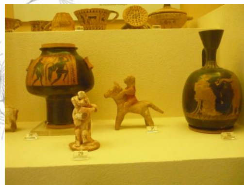
Εικόνα 2: Μουσειακά εκθέματα