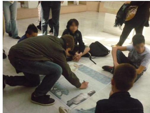
Εικόνα 4: Το παιχνίδι της ακροστιχίδα