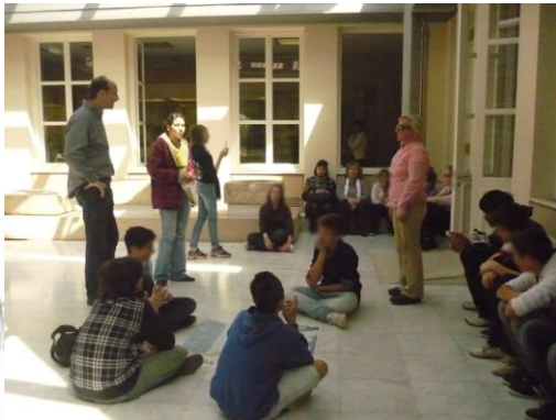
Εικόνα 3: Συζητάμε για τις συνήθειες των ανθρώπων