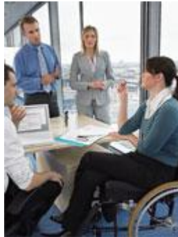
5 Παρουσιάζεται μια ομάδα εργαζομένων. Ανάμεσά τους βρίσκεται μια γυναίκα σε αμαξίδιο.