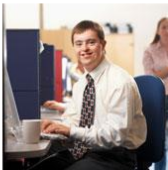
6 Παρουσιάζεται ένας εργαζόμενος με σύνδρομο Down

Τα κράτη-μέλη θα πρέπει να φροντίσουν ώστε τα άτομα με αναπηρία να βρίσκουν δουλειά σε συνηθισμένους χώρους εργασίας.