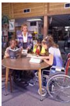
4 Παρουσιάζονται παιδιά στο σχολείο, το ένα κάθεται σε αμαξίδιο

Ειδική Αγωγή και Εκπαίδευση ή αλλιώς ΕΑΕ