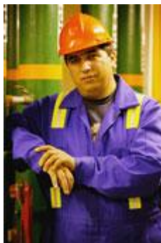
7 Παρουσιάζεται εργαζόμενος να φορά προστατευτικό καπέλο

Τα κράτη-μέλη θα πρέπει να φροντίζουν ώστε οι χώροι εργασίας να είναι ασφαλείς και κανένας να μην τραυματίζεται.